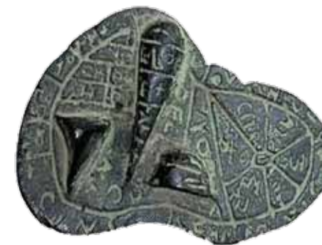
Fegato etrusco bronzeo - IV sec. a.C. - Piacenza

“Dall’epatopatia all’epatocarcinoma: percorsi diagnostici, terapeutici ed assistenziali”