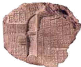
Modello di fegato di pecora in argilla, Babilonia, metà I millennio a. C. Londra, British Museum, inv. BM 50494

Sul modello si leggono i nomi delle parti dell’organo e il loro significato per l’interpretazione dei presagi. Le parti sono indicate con “destra” e “sinistra”. Di solito “destra” è favorevole e “sinistra” sfavorevole. Con l’ausilio di questo modello, l’indovino poteva scoprire cosa veniva predetto dal fegato di una pecora sacrificata.